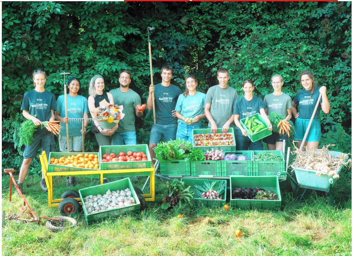
▲ Das heurige Ernteteam des Biohof Osterer in Tribuswinkel. Im Gemüsebau konnten man bei Zwiebel, Knoblauch und Erdäpfel gute Erträge dank der ausreichenden Niederschläge im Frühjahr verzeichnen.

Und welche Aussichten gibt es für den Herbst? „Wie in unserer Region gewohnt, wünschen wir uns mehr Regen. Ohne Bewässerung wäre Gemüseanbau bei uns nicht möglich“, stellt Osterer klar.