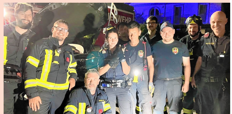
▲ Alle Retter der kleinen Katze auf einem Bild nach der geglückten Rettungsaktion, an der neben der Stadtpolizei vor allem Kameraden der FF Baden-Weikersdorf maßgeblich beteiligt waren.

Die gerettete Babykatze in den Händen einer Stadtpolizistin. Das Tierchen wurde nach dem Rettungseinsatz ins Badener Tierheim gebracht, ihr Besitzer soll sich dort melden.