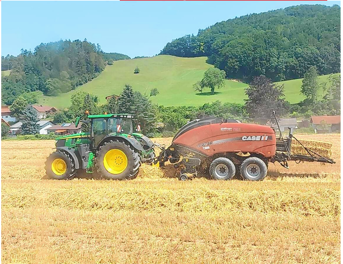
▲ Beim Getreide gab es heuer im Bezirk Lilienfeld heuer im Durchschnitt einen guten Ertrag.

derschläge bekommt, die man im Grünland braucht“, sagt der Kammerobmann.