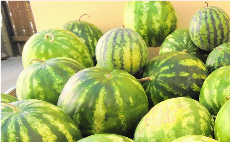
▲ Bei Wassermelonen ist die frühere Ernte im Hochsommer ein Bonus.

wie Müllerthurgauer und Roter Veltliner, bereits zwischen 2. und 5. September zu rechnen. Der Grüne Veltliner dürfte erst Mitte September dran sein. „Sehr positiv auf den Säureaufbau in den Trauben wirken sich die kühlen Nächte aus“, sagt Jungwinzer Polsterer. Dass die sonnigen Sommertage hervorragend für den Reifungsprozess sind, versteht sich von selbst.