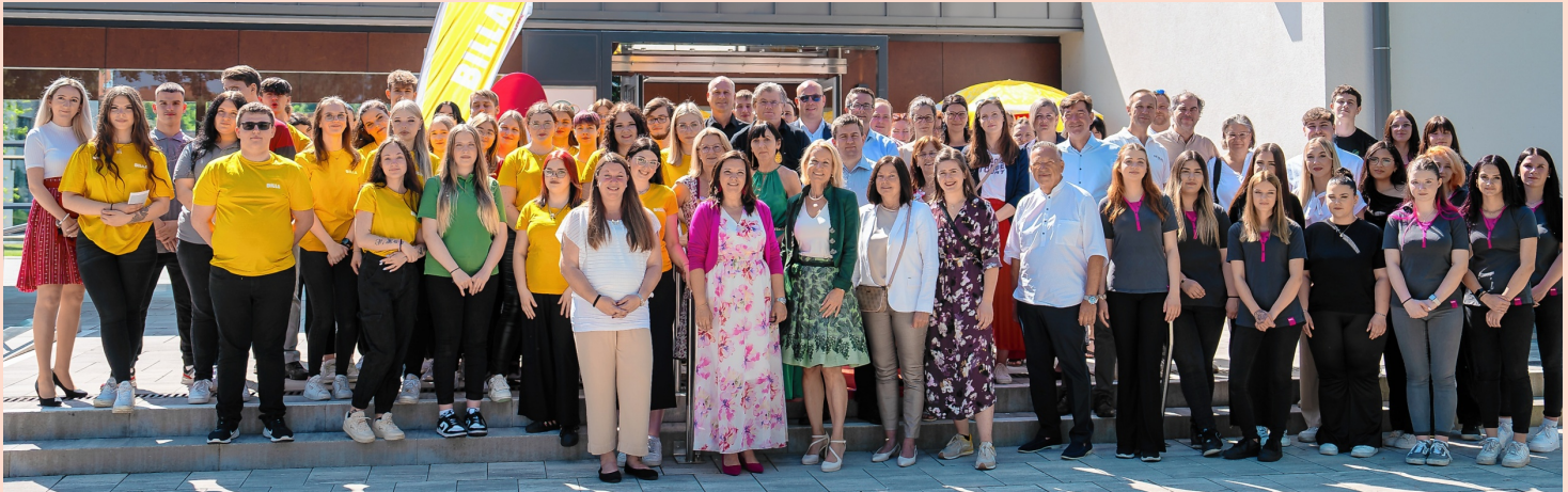
▲ Beim BILLA-Familienfest in der Marktgasse wurde 2.100 Euro für den guten Zweck gesammelt.

ern nicht zu kurz: Im Rahmen einer Tombola konnten 2.100 Euro für den Verein Cosplay Entertainment Austria & World Wide gesammelt werden, der mit Cosplayern anwesend war. Die Spende verwendet der Verein zur Unterstützung schwerkranker Kinder.