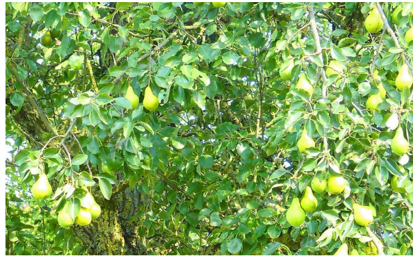
◀ Nach drei mageren Jahren hängen heuer wieder viele Früchte auf den Birnbäumen.