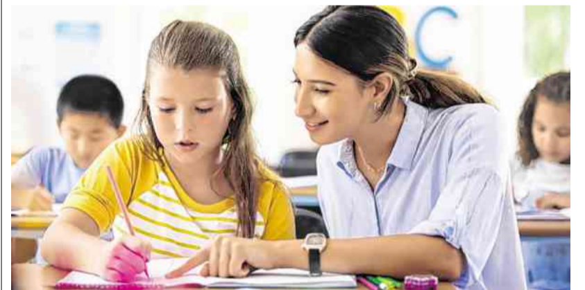
In vier von zehn Volksschulbüchern war Landwirtschaft kein Thema.

Der Verlag hat auf eine Anfrage der OÖNachrichten gestern nicht reagiert. Der Verein und Strasser fordern, dass zwei zusätzliche Agrarexperten in die Schulbuch-Kommission entsendet werden. Den Themen Lebensmittelproduktion und Ernährung sollte in den ersten sechs Schulstufen zumindest jeweils eine Wochenstunde gewidmet werden. (miv)