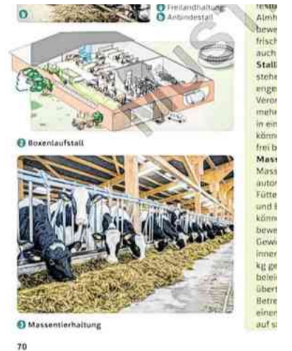
Das abgedruckte Bild zeige keine Massentierhaltung, kritisiert der Verein.

Ein besonderer Dorn im Auge ist Bauernbund-Präsident Strasser, dass heimische Bauernhöfe in manchen Büchern als „Industriebetriebe“ bezeichnet werden. Dadurch entstehe bei Kindern und Jugendlichen ein verzerrtes Bild von